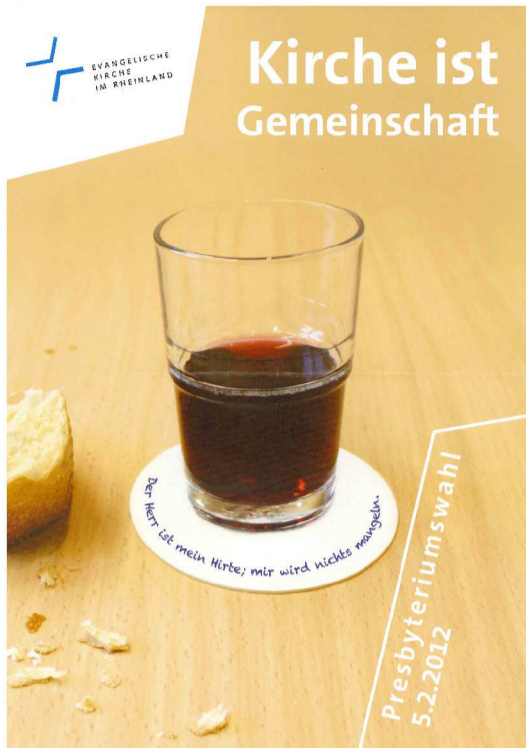
Presbyteriumswahl am 05.02.2012

EVANGELISCHE KIRCHENGEMEINDE LEBACH – SCHMELZ